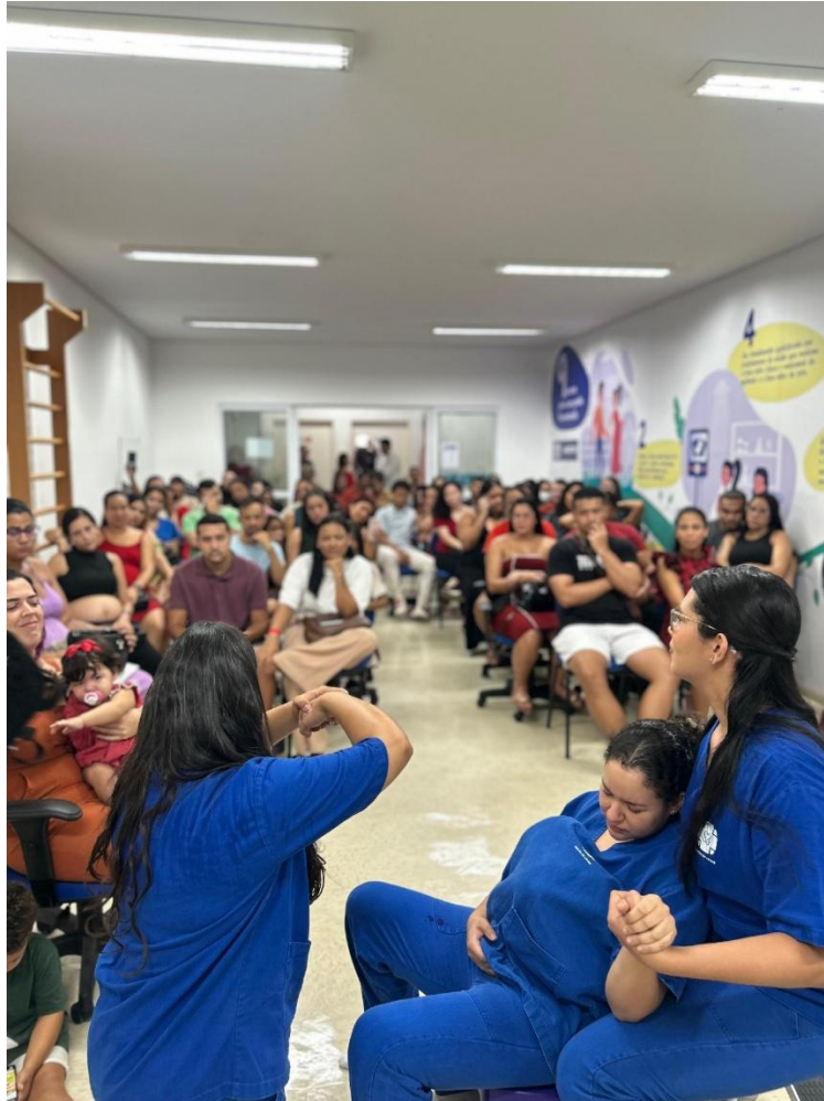
Evento Gestar reúne gestantes e rede de apoio para uma jornada de conhecimento e cuidado

No dia 24 de abril, o Centro de Parto Normal Rita Barradas realizou mais uma edição do Gestar , evento especialmente voltado para gestantes e suas redes de apoio. Com a capacidade máxima de inscrições preenchida, o encontro reforça o compromisso do CPN Rita Barradas com a promoção da saúde materno-infantil, por meio da disseminação de informações seguras, qualificadas e acessíveis à comunidade.